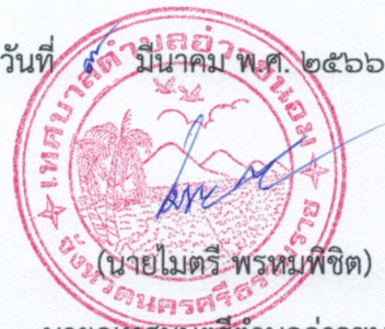
นายกเทศมนตรีตำบลอ่าวขนอม

หมายเหตุ ผู้ประกอบการสามารถจัดเตรียมเอกสารประกอบการเสนอราคา (เอกสารส่วนที่ ๑ และเอกสารส่วนที่ ๒) ในระบบ e-GP ได้ตั้งแต่วันที่ซื้อเอกสารจนถึงวันเสนอราคา